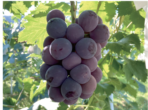
8月2日のピオーネです

今年も暑い夏です 中国地方では観測史上最も早く、6月27日に梅雨明けとなりました。例年より1ヶ月程度早いので、夏が1ヶ月早く長くなってしまいました。