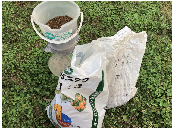
原料が魚かす・酒粕肥料です

つまり、与える肥料の種類・量が適切で、夏の夜温が低ければ糖度があがると言えます。